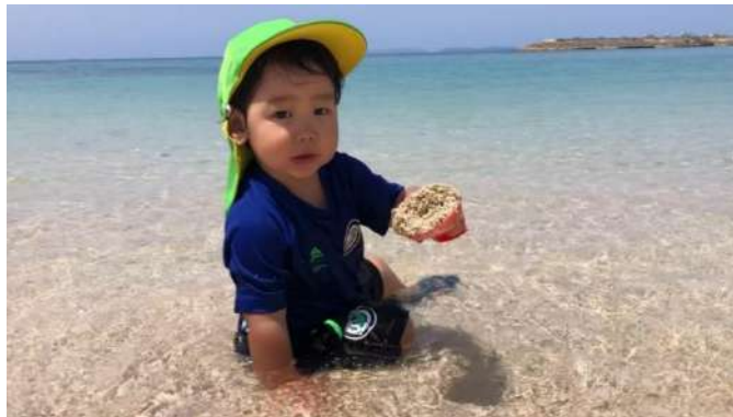
青い海で遊びました。 (たつきさん)

ゴールデンウィークのお写真をありがとうござ いました。カメラを向けているお父さまやお母 さまが愛しいわが子の「今」を撮影してくださ り、ありがとうございます。 「今」が毎日変わること に成長が嬉しくなりますね。