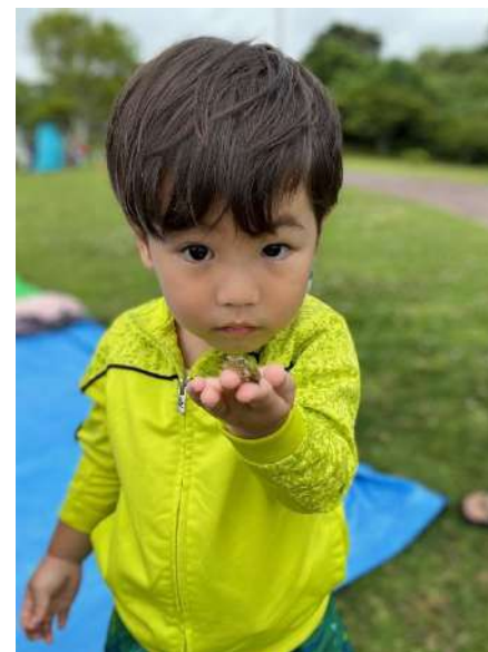
倉敷ダムに行ってパパとカエルを見つけたよ♪(しゅんげんさん)