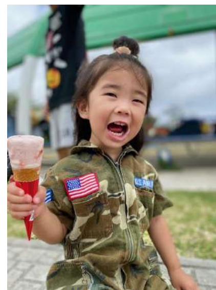
大好きな公園とアイス♪(ひなみさん)