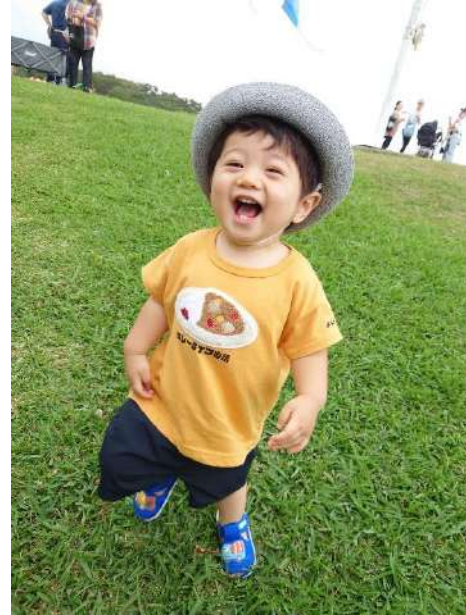
こいのぼり祭り、家族四世代で。 (しうさん)