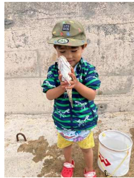
伊是名島で釣り! イシミーバイ獲ったぞー!(とうりさん)